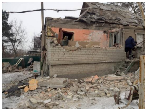
м. Авдіївка, Україна - щонайменше, 176 будинків були пошкоджені або зруйновані через сплеск бойових дій 29 січня.