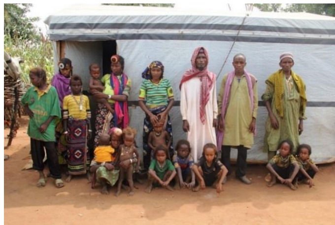
Crédit : OCHA/N. Frérotte. Les besoins de base des retournés, tel que les abris, sont parmi les plus urgents avant la mise en place de solutions durables.

Des 73 000 retournés tchadiens vivant au sud, 6 300 ont été enregistrés par le HCR afin d'obtenir des papiers officiels d'identité et 17 195 extraits de naissance ont été délivrés aux retournés et communautés hôtes.