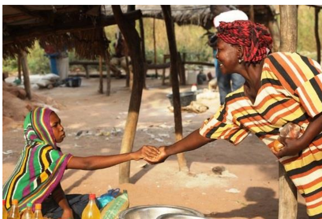
Les retournés ont besoin des solutions durables pour sortir de l'assistance humanitaire.

Sans donner aux retournés la capacité de répondre par eux-mêmes à leurs besoins prioritaires, les conditions de vie de ces personnes continueront à se détériorer. Le Gouvernement avait initié, en collaboration avec les acteurs humanitaires, un Plan de réponse global en faveur des retournés tchadiens de la RCA (2015-2019) dont l'objectif était de «passer de l'assistance humanitaire à une autonomisation durable».