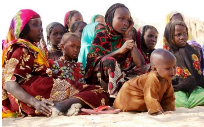
Les femmes et les enfants sont également victimes d'attaques.

La sécurité et la sûreté constituent une condition préalable cruciale pour le succès de solutions durables.