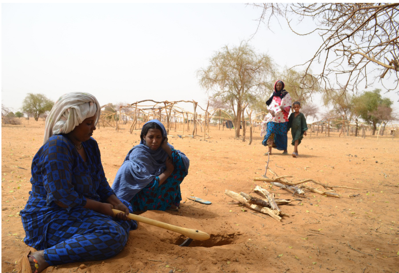
Site de Bakoret dans la commune de Tilia