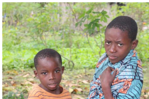
A Pweto, les enfants sont parmi les populations les plus affectées par les conflits.

Le Fonds des Nations Unies pour l'Enfance (Unicef), finance, depuis deux mois, les activités de prise en charge d'une centaine d'enfants non accompagnés, dans la cité de Pweto. Il s'agit de la prise en charge médicale, du support dans les familles d'accueil et de la réunification familiale. En collaboration avec son partenaire l'ONG APEDE, UNICEF assure aussi les soins médicaux pour 30 enfants blessés suite aux violences à Pweto. Jusque-là, les acteurs de protection de l'enfance ont répertorié 347 enfants répartis dans les villages Kansabala, Kasama, Kipeto, Lukonzolwa, Mutabi et Mwenge. Des recherches continuent pour identifier d'autres enfants parmi les personnes déplacées internes qui ont été séparés de leurs familles et communautés, à cause des conflits et violences armés. Le projet prend fin d'ici la fin