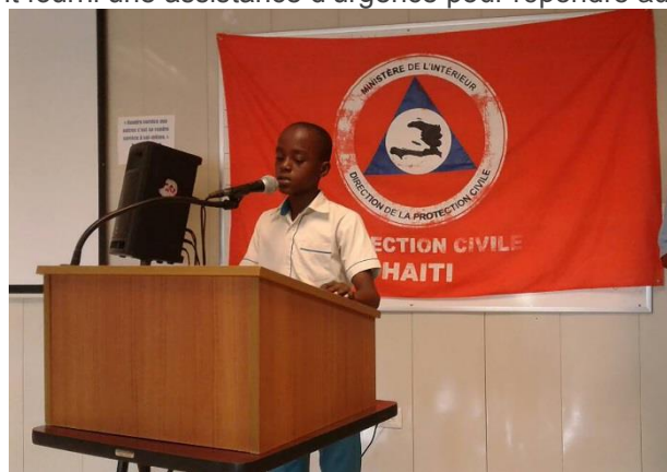
Un jeune écolier présentant le cahier de charge ayant des recommandations aux autorités dans le cadre de la protection de l'enfant lors des activités de commémoration du premier anniversaire de l'Ouragan Matthew. 2017.

Pour venir en appui aux 1.4 millions de personnes dans le besoin d'assistance suite à l'ouragan Matthew, la communauté humanitaire en Haïti a apporté un appui à différentes phases. Les acteurs humanitaires ont fourni une assistance d'urgence pour répondre aux besoins de base des populations affectées par le passage de l'ouragan, en accord aux principes humanitaires de base. Ensuite, ils ont coordonné les actions de relèvement précoce tout en mettant en œuvre le processus de transition vers le développement communautaire. Cependant, dans les différents secteurs, des défis importants restent à relever pour rétablir la résilience des populations déjà vulnérables à cause des effets de différents phénomènes et leurs expositions fréquentes à des aléas climatiques et sismiques.