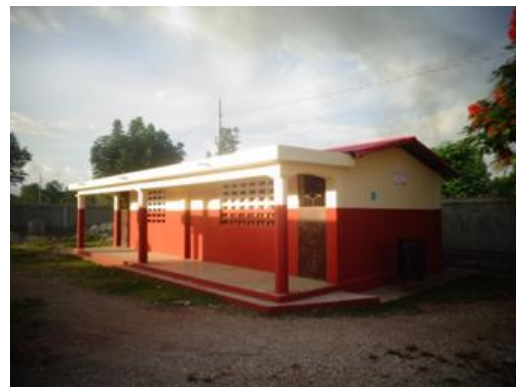
Vue de l'Ecole nationale Remy Zamor de Laval, dans la ville des Cayes, Département du Sud d'Haïti, avant et après les travaux de réhabilitation. Cette intervention rentre dans le cadre du programme de réhabilitation des écoles affectées par l'ouragan Matthew en 2016, mis en œuvre par l'UNICEF en partenariat avec la Commission Épiscopale pour l'éducation catholique grâce à un financement de l'USAID.