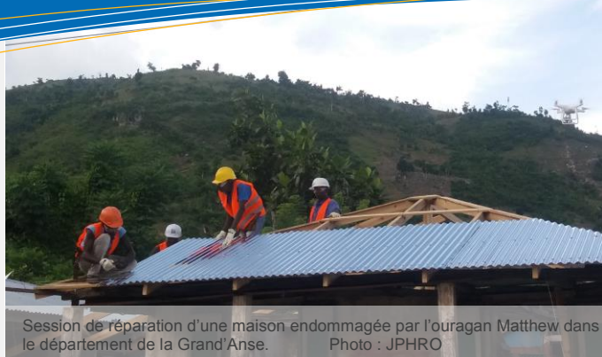
Session de réparation d'une maison endommagée par l'ouragan Matthew dans le département de la Grand'Anse.