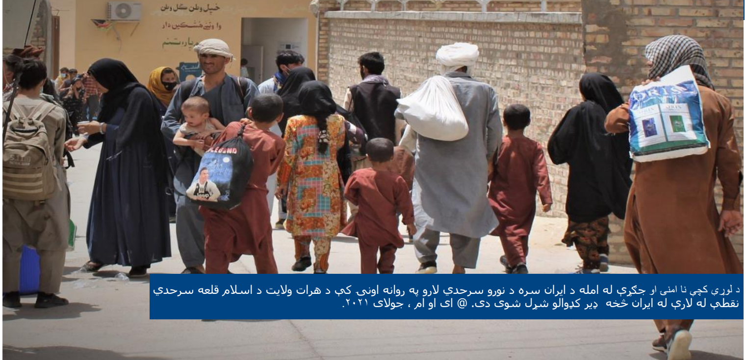
د لوري کچې نا امنۍ او جگړې له امله د ايران سره د نورو سرحدې لارو په روانه اونۍ کې د هرات ولايت د اسلام قلعه سرحدې نقطه له لارې له ايران څخه ډير کډوالو شيرل شوي دي. @ ای او ام ، جولای ۲۰۲۱.