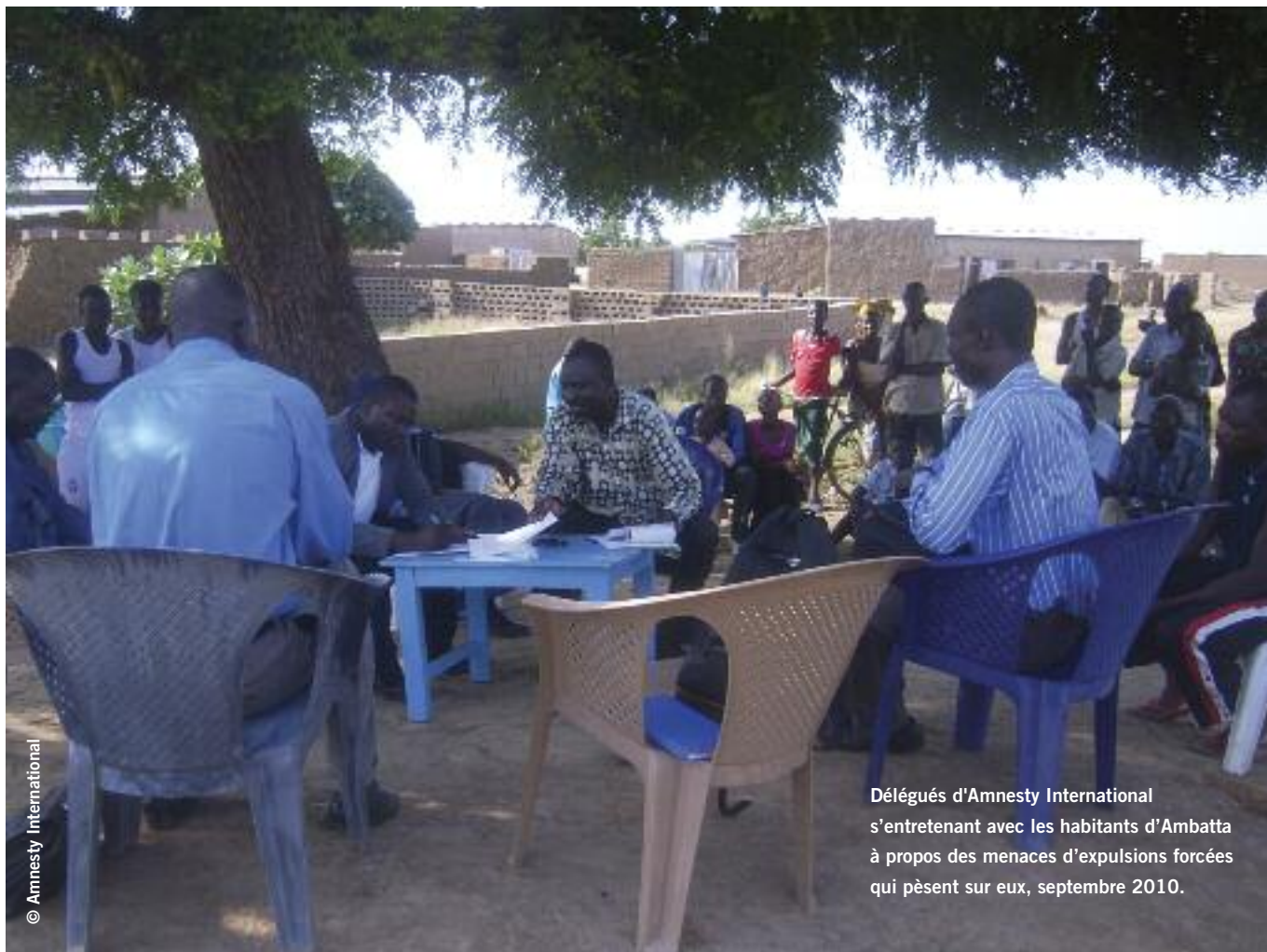
Délégués d'Amnesty International s'entretenant avec les habitants d'Ambatta à propos des menaces d'expulsions forcées qui pèsent sur eux, septembre 2010.

intervenir qu'en dernier recours, une fois que toutes les autres solutions possibles ont été envisagées, et à condition que toutes les garanties nécessaires pour une procédure satisfaisante soient en place, notamment :