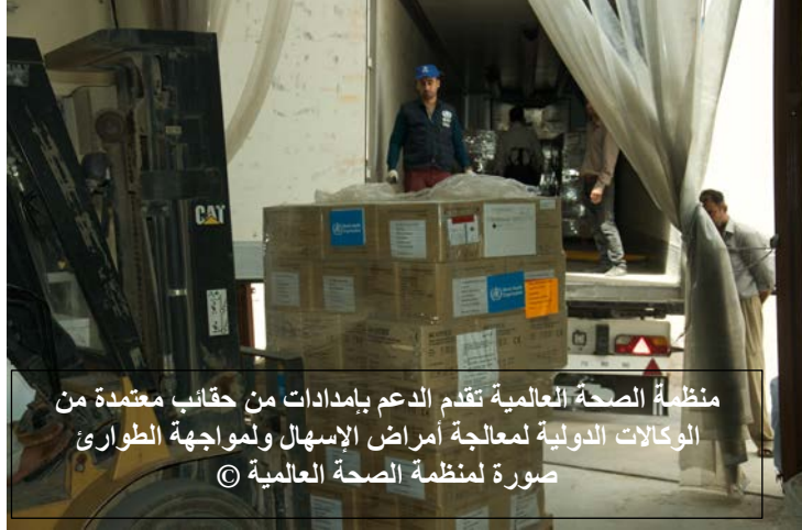
منظمة الصحة العالمية تقدم الدعم بإمدادات من حقائب معتمدة من الوكالات الدولية لمعالجة أمراض الإسهال ولمواجهة الطوارئ