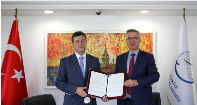
UNHCR Temsilcisi Philippe Leclerc ve Türkiye Adalet Akademisi Başkanı Muhitin Özdemir, Türkiye'nin uluslararası koruma sistemiyle ilgili ortak faaliyetler yürütmek üzere işbirliği protokolü imzaladı.

Türkiye Adalet Akademisi ve UNHCR, Türkiye'nin uluslararası koruma sistemiyle ilgili karşılıklı işbirliğinin sürdürülmesi için 20 Eylül'de işbirliği protokolü imzalamıştır. Protokol kapsamında öngörülen faaliyetler çerçevesinde UNHCR, uluslararası mülteci hukuku farkındalığı oluşturmak üzere adli ve idari yargıya görev yapan hâkimler, savcılar ve hâkim ve savcı adaylarıyla etkinlik düzenleyecektir. Eğitimcilerin eğitimi, eğitim modüllerinin geliştirilmesi ve geçici koruma ve uluslararası koruma başvuru ve statü sahibi nüfusu yoğun kentlerde bölge çalıştayları ve yuvarlak masa toplantıları gibi birçok faaliyetin de protokol kapsamında hayata geçirilmesi öngörülmüştür.