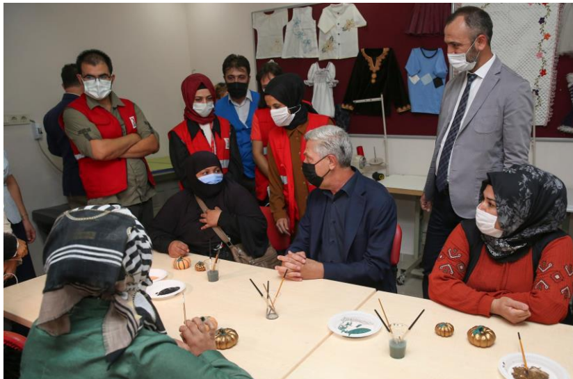
UNHCR Yüksek Komiseri Filippo Grandi, 7-11 Eylül tarihlerinde Türkiye'yi ziyaret etti. Yüksek Komiser'in ziyaretiyle ilgili basın bildirisi için tıklayın .