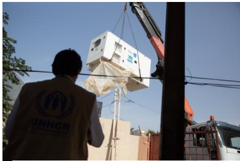
مفوضية اللاجئين تقوم بتوصيل مولد كهرباء للمركز الصحي قرقارش.

ما تزال المساعدة الطبية التي تقدمها المفوضية في ليبيا مستمرة، حيث قدمت لجنة الإنقاذ الدولية، شريكة المفوضية، 62 استشارة طبية و 20 إحالة في المركز المجتمعي في طرابلس. في مصراتة (200 كم شرق طرابلس) قدمت لجنة الإنقاذ الدولية 162 استشارة طبية و 70 إحالة. في 27 سبتمبر، وفي إطار استجابتها المستمرة للمخاوف الصحية المتزايدة في ليبيا، قامت المفوضية بتزويد المركز الصحي قرقارش في طرابلس بمولد 100 كيلو فولت أمبير. ويعدّ المركز مرفقاً يخدم الليبيين واللاجئين والمهاجرين على حد سواء.