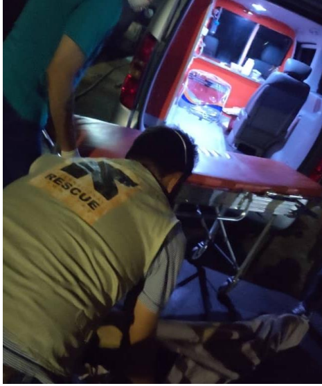
لجنة الإنقاذ الدولية (IRC)، شريكة المفوضية، تقدم المساعدات الطبية في إحدى نقاط الإنزال.

حتى 17 سبتمبر، سُجِّل إنقاذ/اعتراض 8,074 لاجئاً ومهاجرًا في البحر من قبل حرس السواحل الليبي وإنزالهم في ليبيا. في 14 سبتمبر، وصل 45 شخصاً نجواً من انقلاب قارب إلى قاعدة طرابلس البحرية.