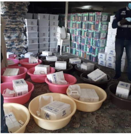
تقديم المساعدات في مخيم الفلاح 1.

في 10 يناير بدأت مفوضية اللاجئين من خلال شريكها الوطني، الهيئة الليبية للإغاثة، حملة استمرت لمدة يومين وزعت فيها مستلزمات شتوية في مخيم الفلاح 1 للنازحين داخلياً في طرابلس. واستهدفت المساعدة 1,105 من النازحين داخلياً (279 عائلة) تلقوا مستلزمات النظافة والملابس الشتوية والقفازات والجوارب والمصابيح الشمسية والبطانيات والمراتب وأوعية المياه ومعاطف المطر ومستلزمات الأطفال ومستلزمات المطبخ والأغطية البلاستيكية. في الأسبوع المقبل، ستستهدف المساعدات الشتوية ثلاث مخيمات أخرى للنازحين في طرابلس. كما وزع المجلس الدنماركي للاجئين، شريك المفوضية، 481 بطاقة مالية مسبقة الدفع على العائدين من النزوح في منطقتي أبو سليم وعين زارة في طرابلس. حتى الآن ومنذ بداية عام 2020، قدمت المفوضية مواد الإغاثة الأساسية إلى 33,748 نازحاً والمساعدات المالية إلى 16,842 نازحاً.