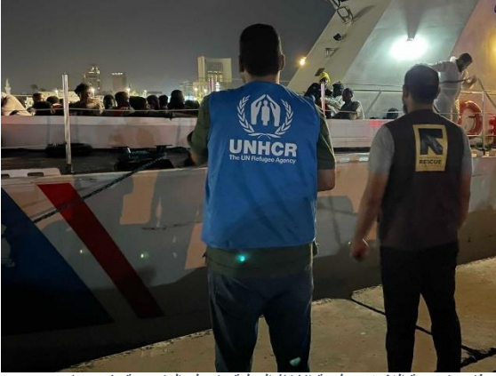
موظفو مفوضية اللاجئين ولجنة الإنقاذ الدولية، شريك المفوضية، في ميناء طرابلس التجاري خلال إحدى عمليات الإنزال الحديثة.