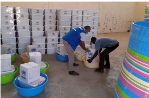
توزيع حزم النظافة على النازحين داخلياً في بنغازي.

خلال فترة التقرير، قامت المفوضية بإجراءات 306 لاجئين وطالبي لجوء في مركز تسجيل المفوضية في طرابلس، وشمل ذلك إجراءات تحديد وضع اللجوء وإعادة التوطين لـ 60 شخصاً. سجلت المفوضية 131 شخصاً من كل من: السودان (96)، وسوريا (23)، وإريتريا (10) وإثيوبيا (1).