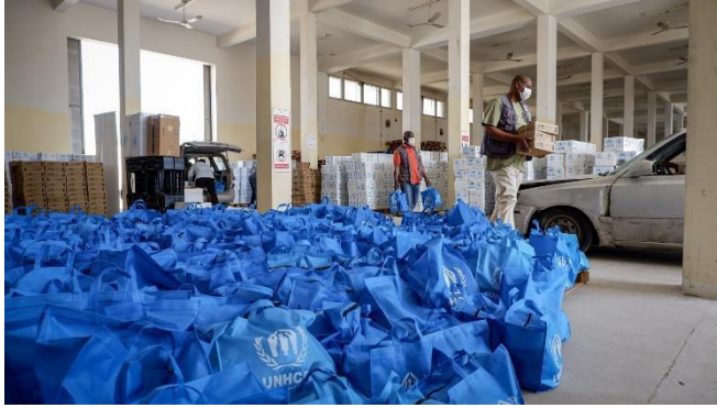
توزيع السلات الغذائية الرمضانية على اللاجئين في طرابلس.

بالتنسيق مع برنامج الأغذية العالمي، بدأت المفوضية حملتها الرمضانية لتوزيع المواد الغذائية في طرابلس والمدن المجاورة. استمر التوزيع على مدار الأسبوع حيث استهدف 5,339 لاجئاً وطالب لجوء (1,454 عائلة) في طرابلس، بينما سيستهدف حوالي 4,000 آخرين في الزاوية وزوارة (102 كم غرب طرابلس) ومصراتة (190 كم شرق طرابلس).