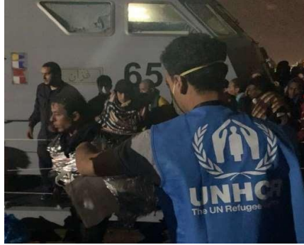
موظفو المفوضية وهم يقدمون المساعدة في نقطة الإنزال.