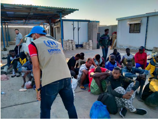
تقديم المساعدات في ميناء الزاوية

1 المنظمة الدولية للهجرة - مصفوفة تتبع النزوح: يونيو 2021 2 البيانات حتى تاريخ 13 سبتمبر 2021