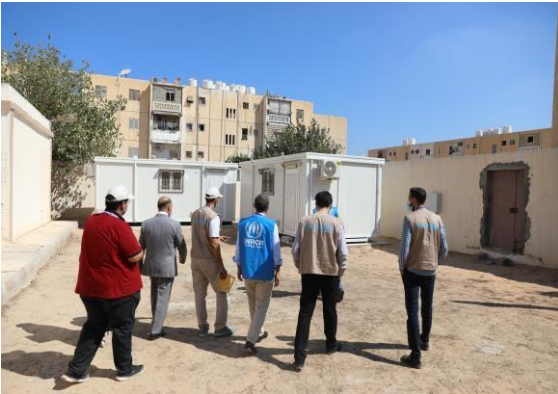
تقديم فصلين متنقلين إلى مركز تدريب وتطوير المرأة بحي الأندلس