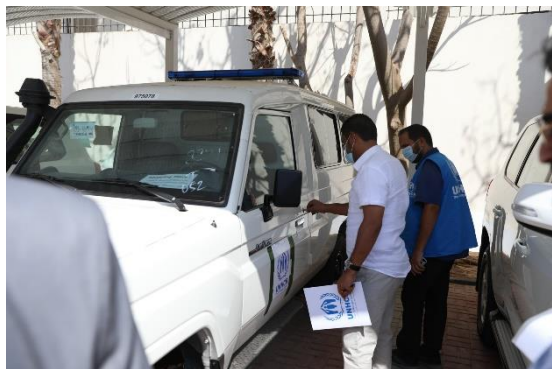
تسليم سيارة إسعاف إلى بلدية بني وليد

في 13 سبتمبر، تبرعت مفوضية اللاجئين بسيارة إسعاف لبلدية بني وليد (180 كلم جنوب شرق طرابلس). وفي الأسبوع السابق (9 سبتمبر)، تبرعت المفوضية بخمس سيارات إسعاف أخرى لبلديات محلية وإلى مؤسسة الرعاية الصحية الأولية في طرابلس لأجل دعم النظام الصحي الليبي. منذ عام 2020، نفذت المفوضية 67 من المشاريع سريعة التأثير ليستفيد منها اللاجئون وطالبو اللجوء والنازحون داخليا والمجتمعات المضيفة لهم.