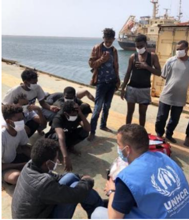
عملية إنزال في طرابلس.

1 المنظمة الدولية للهجرة - مصفوفة تتبع النزوح: ديسمبر 2020 2 البيانات حتى تاريخ 1 مايو 2021