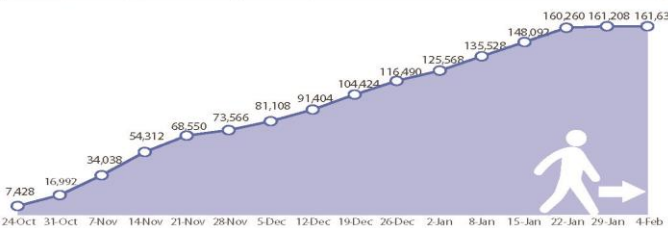
The boundaries and names shown and the designations used on this map do not imply official endorsement or acceptance by the United Nations. Map created on 6 February, 2017.

• نزیکهی 24,000 مندال دهستیان کردوه به خویندن له بهرنامهکانی پهروهردهیی نافهرمی له ناو قوتابخانه رهمشالیهی که له شوینهکانی ناوارمیبون.