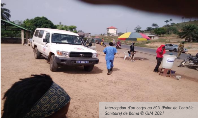
Interception d'un corps au PCS (Point de Contrôle Sanitaire) de Boma

La Guinée fait face, depuis février 2021, à la réapparition de l'épidémie d'Ebola. Pour la première fois depuis 2016, des cas de fièvre hémorragiques causés par le virus ont été recensés dans la préfecture de N'zérékoré, dans le sud-est du pays, conduisant à plusieurs morts. La première victime, identifiée dans la sous-préfecture de Gouéké, est une infirmière décédée fin janvier. Tous les autres cas sont des personnes ayant assisté aux obsèques le 1 er février 2021. Le 14 février, le Ministère de la Santé de Guinée a officiellement déclaré une épidémie de maladie à virus Ebola (MVE).