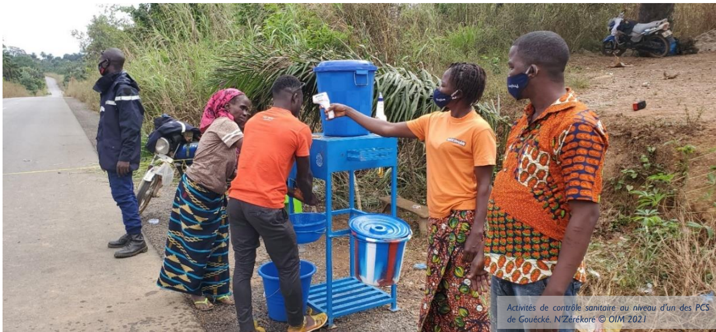
Activités de contrôle sanitaire au niveau d'un des PCS de Gouécké, N'Zérékoré

L'alerte a été validée et le suspect fût transféré au CT-Epi.