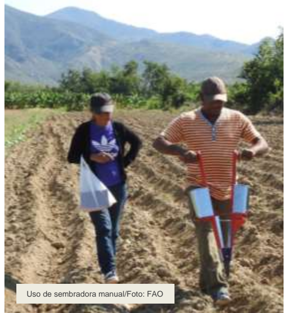
Uso de sembradora manual