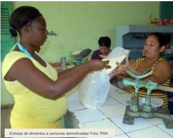
Entrega de alimentos a personas damnificadas