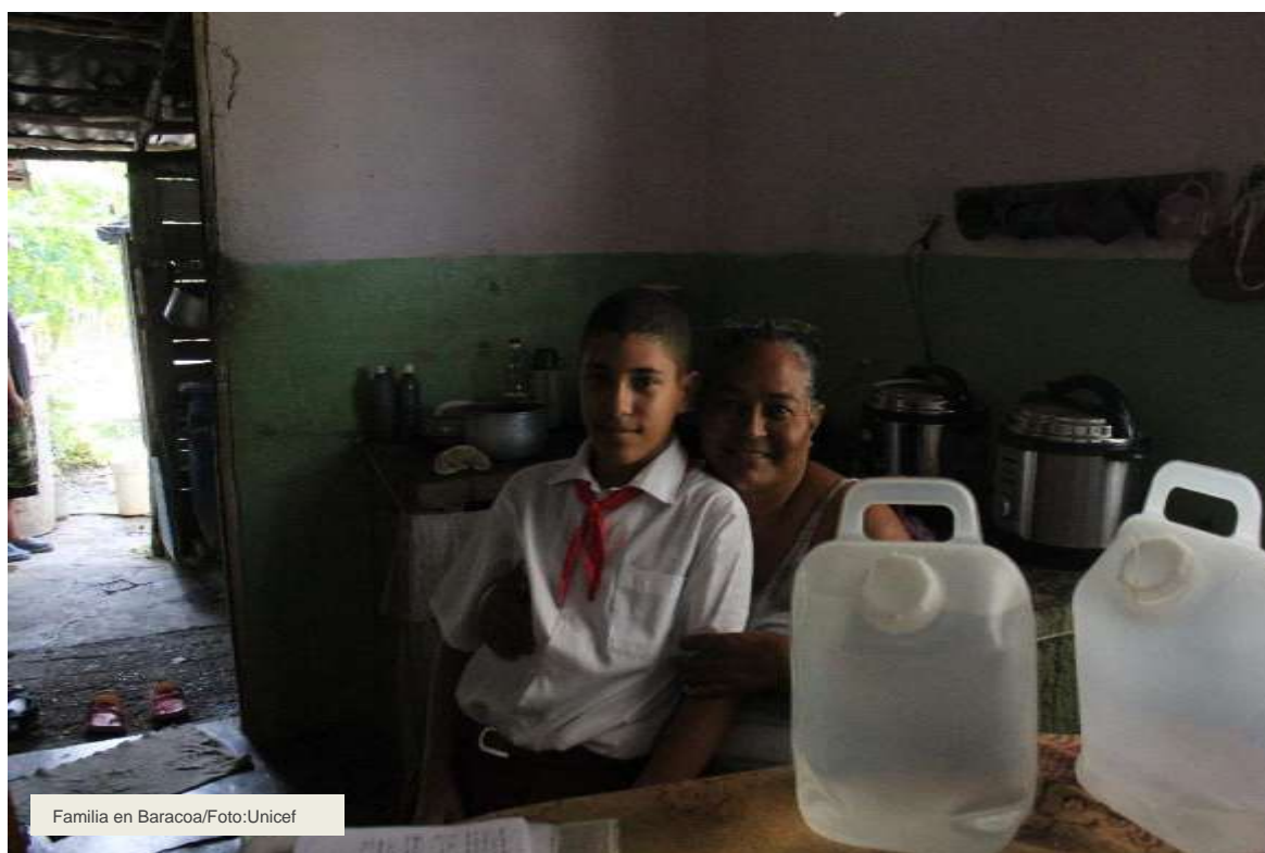
Familia en Baracoa