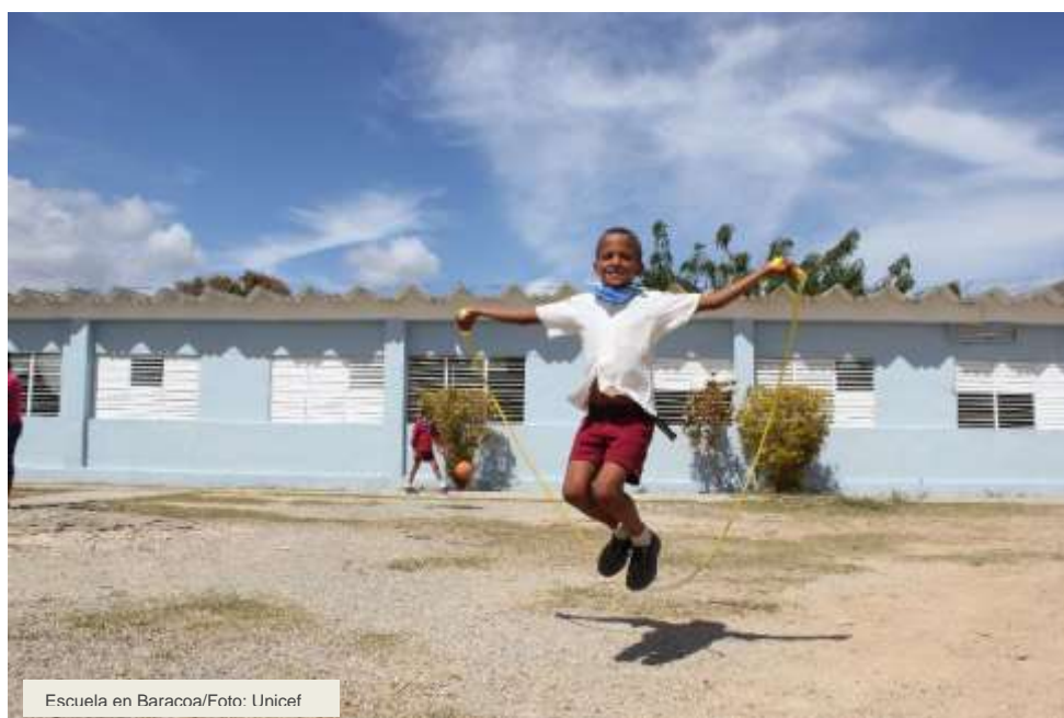
Escuela en Baracoa