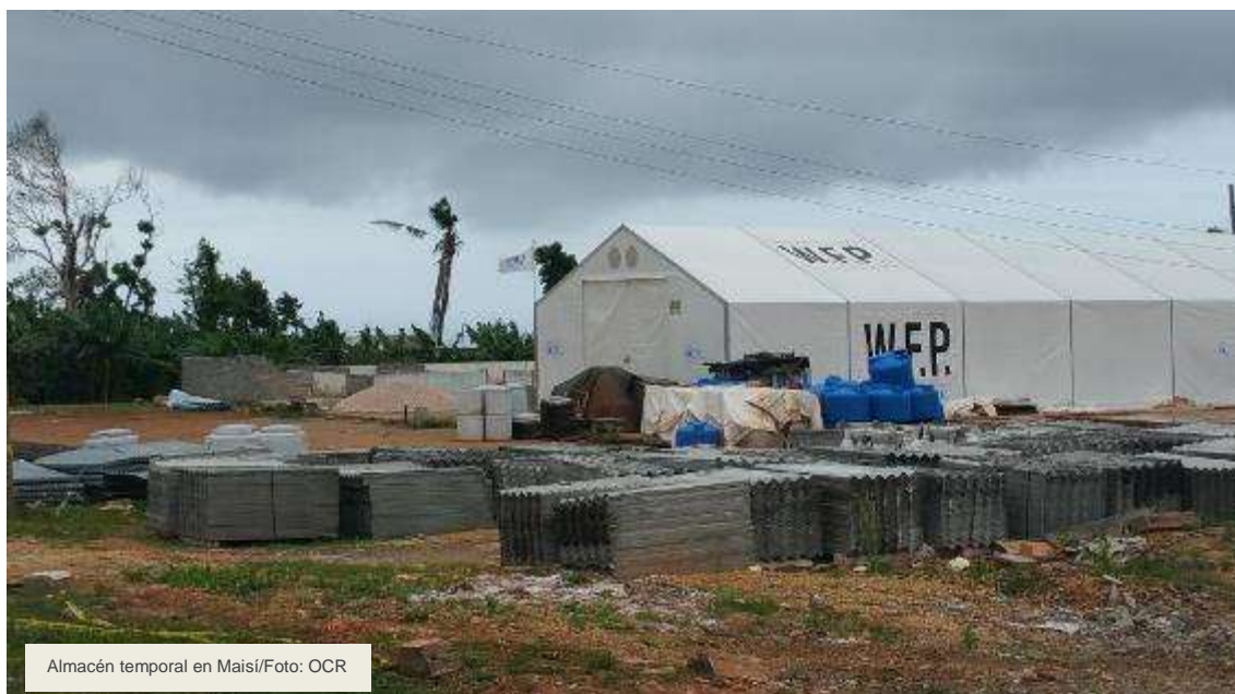
Almacén temporal en Maisí