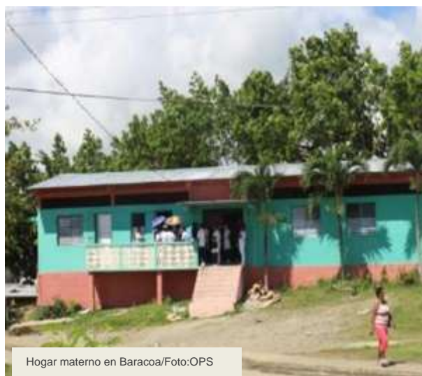
Hogar materno en Baracoa