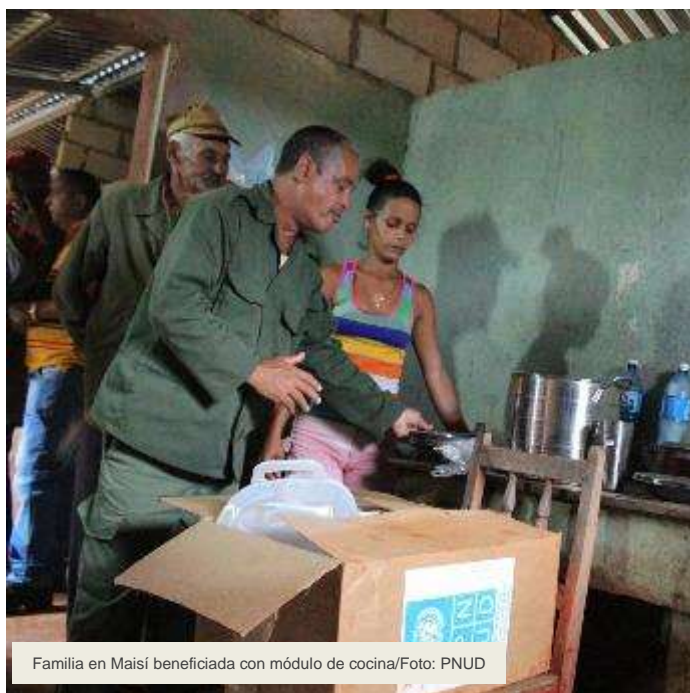
Familia en Maisí beneficiada con módulo de cocina