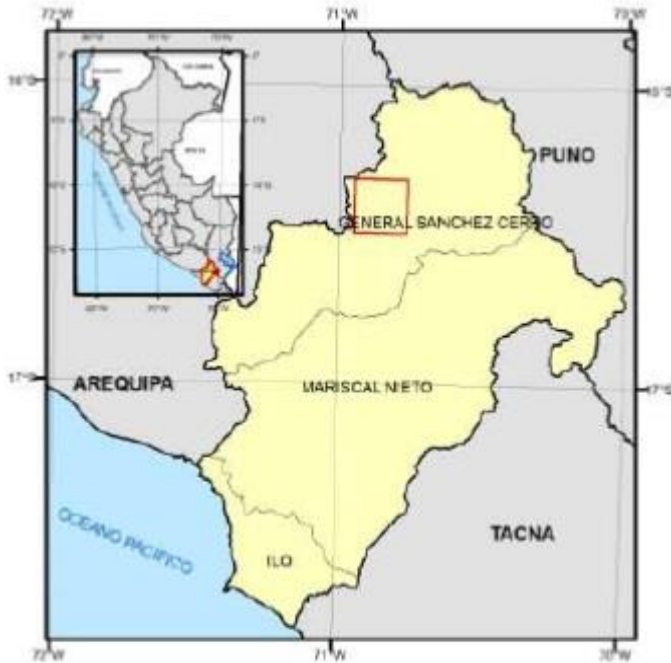
Mapa de Ubicación Elaborado por COEN-INDECI

Al Sur y Sureste del volcán Ubinas hay alrededor de 30 comunidades y localidades expuestas a la influencia del volcán, en las que habitan alrededor de 4,000 personas. Al Norte y Noreste en el distrito San Juan de Tarucani de la Provincia de Arequipa, región Arequipa son 10 las comunidades más expuestas, habitadas por alrededor de 1,000 personas. Todas estas comunidades se dedican principalmente a actividades agropecuarias, con énfasis en la crianza de alpacas y llamas en San Juan de Tarucani.