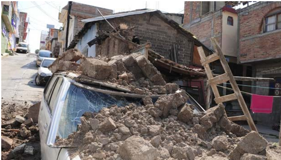
MÉXICO: El sismo de 7.2 grados tuvo su epicentro a 41 kilómetros al sur de Petatlán, estado de Guerrero. ©Cuartoscuro.

Fuente: Coordinación Nacional de Protección Civil - Secretaría de Gobernación.