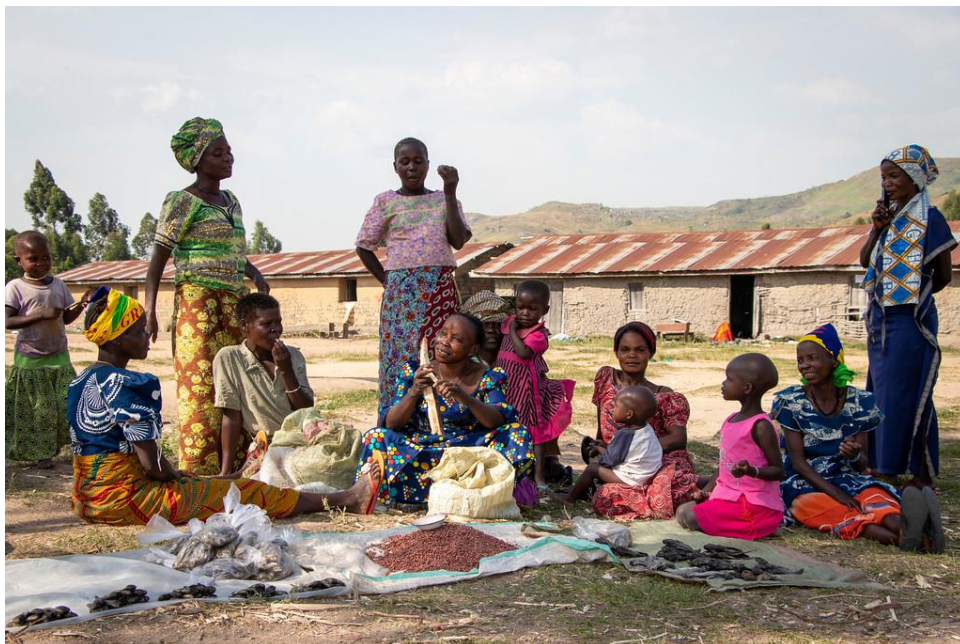
Des femmes déplacées sur un marché improvisé devant une école primaire en Ituri

Par ailleurs, au lendemain de l'attaque du 23 septembre 2021, près d'une dizaine d'organisations ont retiré temporairement leurs personnels de Komanda. Une assistance en nourriture et articles ménagers essentiels, ciblant plus de 45 000 personnes a ainsi été suspendue sur l'axe Komanda – Mambasa et autour de Komanda.