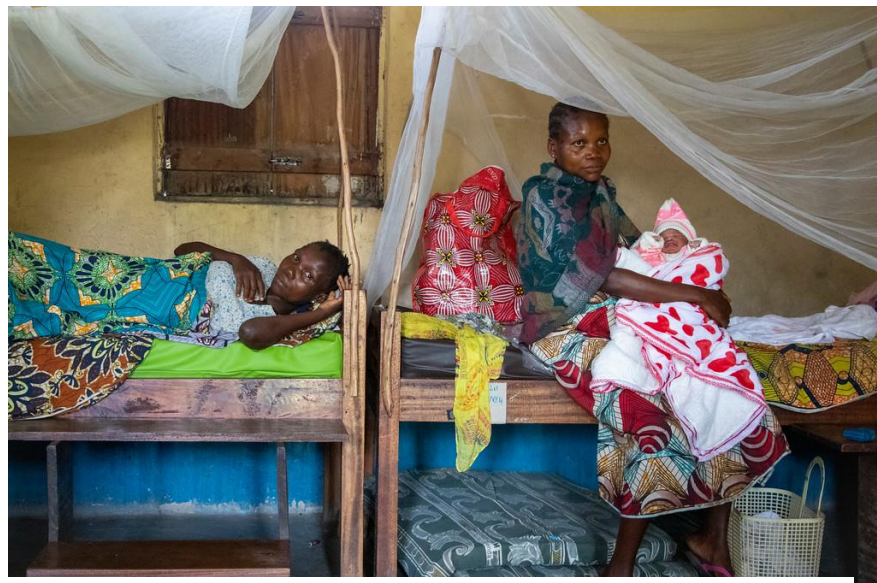
Deux femmes déplacées se reposent dans leurs lits dans un centre de santé en Ituri

en cours avec les autorités sanitaires de Komanda pour une réorientation des paquets d'assistance médicale des aires santé désertées de leurs habitants, vers celles qui font face à l'afflux de déplacés. Parmi les aires de santé désertées on compte Bei, Komanda, Makayakanga et Mangiva, en zone de santé de Komanda.