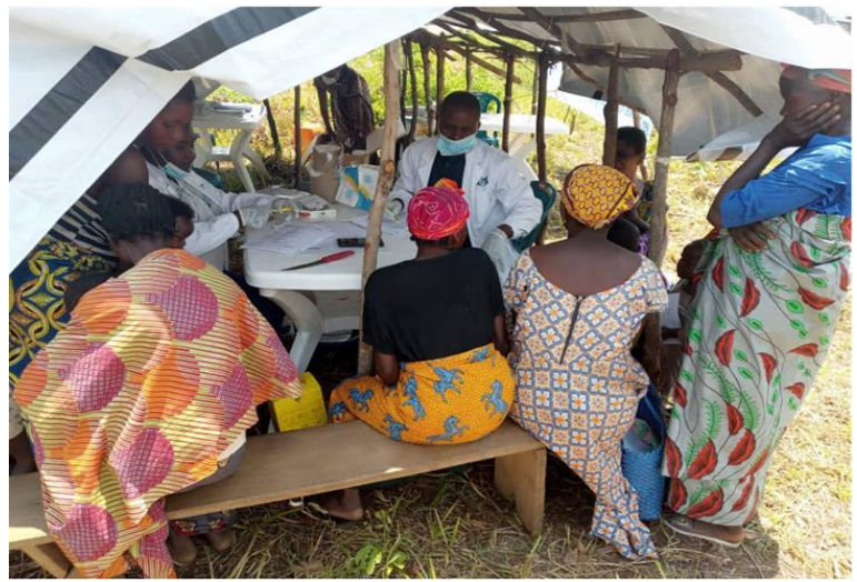
Mise en œuvre du projet d'appui aux SSP aux personnes retournées et déplacées dans les ZS de Nyunzu et Nyemba (AIDES)

CLUSTER SANTÉ République Démocratique du Congo