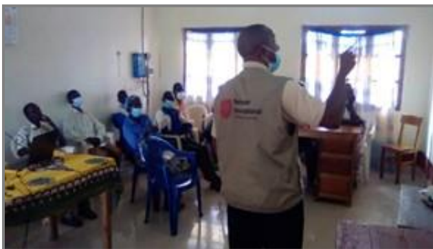
Formation de Wash-Fit/PCI à l'HGR LOGO