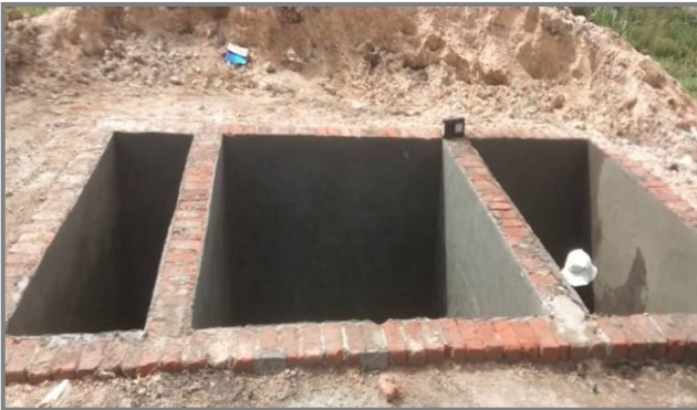
MEDAIR avec financement MEDICOR : Construction en cours de latrines à CS Vilo

Les frontières et les noms indiqués et les désignations employées sur cette carte n'impliquent pas reconnaissance ou acceptation officielle par l'OMS. Date de M. A J: 31 Aout 2021