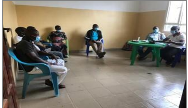
La première rencontre du comité de santé environnementale à Mangusu