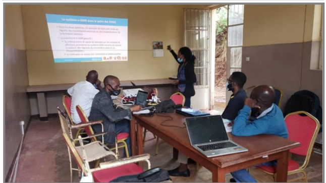
Formation des équipes cadres de la DPS sur SMIR du projet OMS financé par ECHO