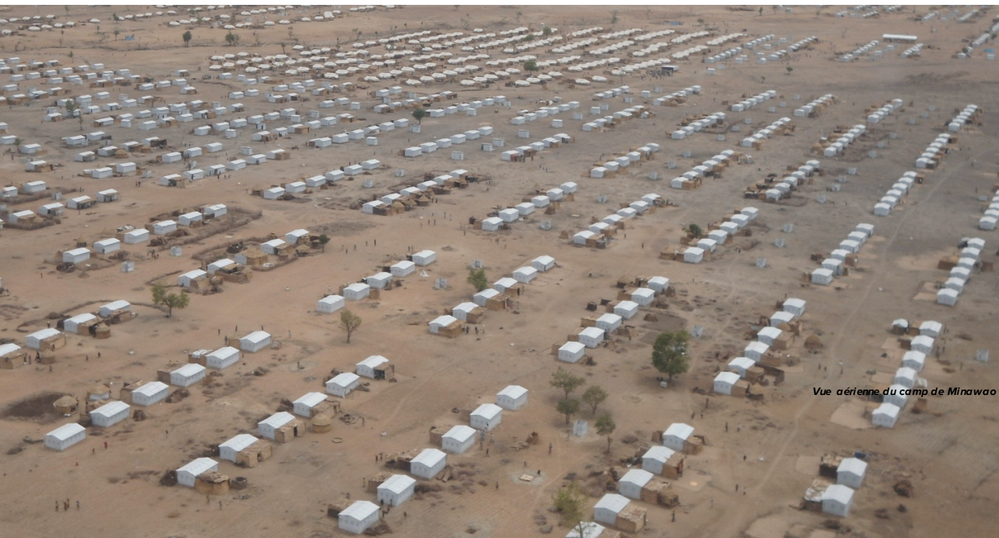
Vue aérienne du camp de Minawao