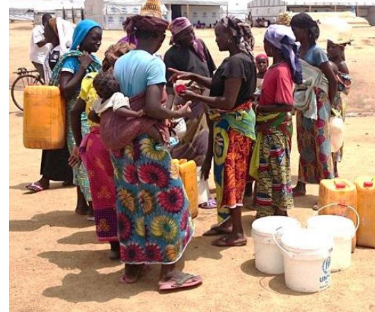
Réfugiés à un point d'eau