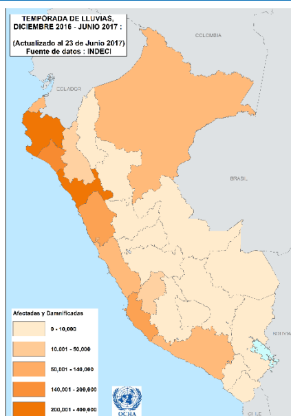
Mapa: cantidad de afectados y damnificados