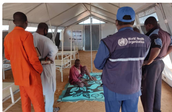
Des acteurs de la riposte sur le site de Gamaram Sofoua (Zinder), aménagé pour la prise en charge des cas de choléra, Credit : OMS

La principale cause de l'épidémie de choléra est d'origine hydrique. Elle est liée à la consommation par les populations riveraines de l'eau de la rivière Goulbi pour la région de Maradi notamment et à la précarité des conditions d'hygiène et d'assainissement. La région de Maradi compte également des cas importés du Nigéria voisin (110 cas) où l'épidémie sévit depuis plusieurs mois. Une autre cause et non des moindres reste le trafic transfrontalier quotidien entre les régions de Maradi, Zinder, Dosso et Tahoua avec les Etats du Nord du Nigéria abritant déjà des foyers de l'épidémie.