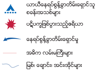
ရှမ်းအရှေ့ အသစ်ထပ်မံနေရပ်စွန့်ခွာတိမ်းရှောင်သူများရှိသည့်နေရာ