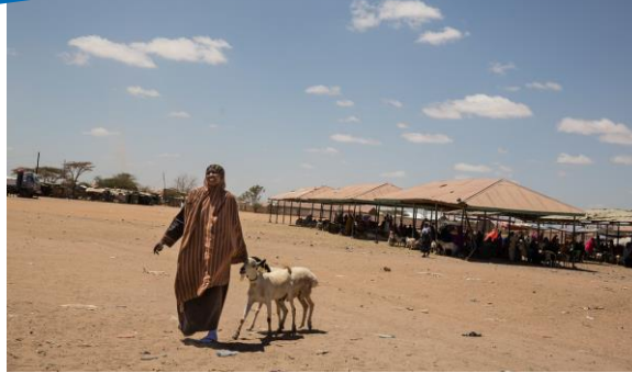
Suuq xoolo oo ku yaalla Burco, Somaliland