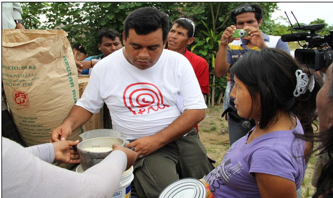
Gerencia Sub Regional de Alto Amazonas entrega alimentos a las personas afectadas del distrito de Yurimaguas – Provincia de Alto Amazonas