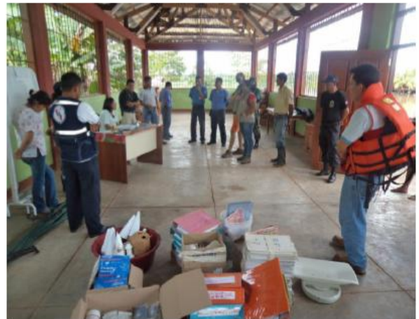
Personal de Salud evacúa sus bienes a un local comunal, a fin de continuar la atención Distrito de Yurimaguas – Provincia de Alto Amazonas