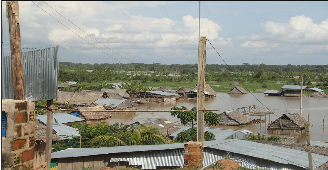
Viviendas afectadas por el incremento del nivel del Rio Huallaga distrito de Yurimaguas – Provincia de Alto Amazonas