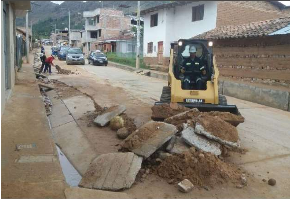
Intervención del PNC Maquinarias en el distrito de Baños del Inca