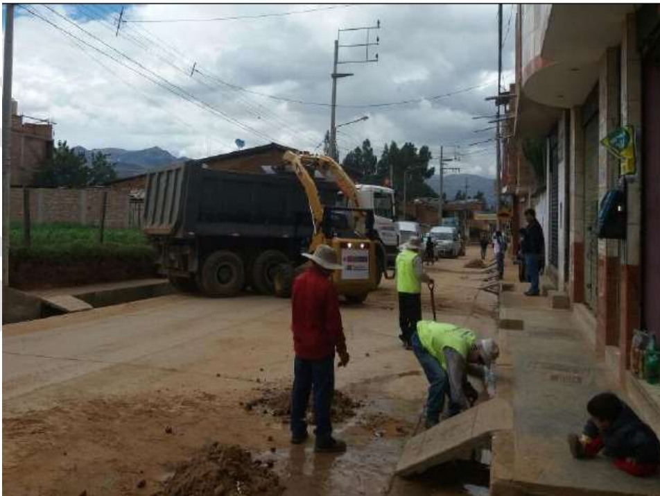
Limpieza de calles y eliminación de material de arrastre en el distrito de Baños del Inca