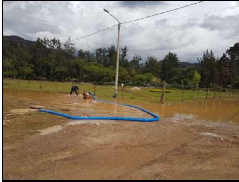
Calles y canales de regadío afectados