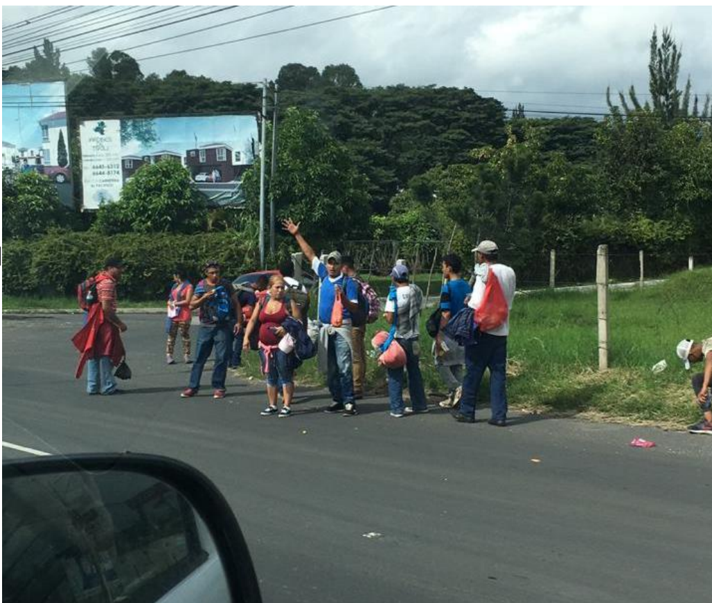
Foto 2. Personas de la caravana de hondureños viajando de ciudad Guatemala hacia la frontera con México (18/10/2018)