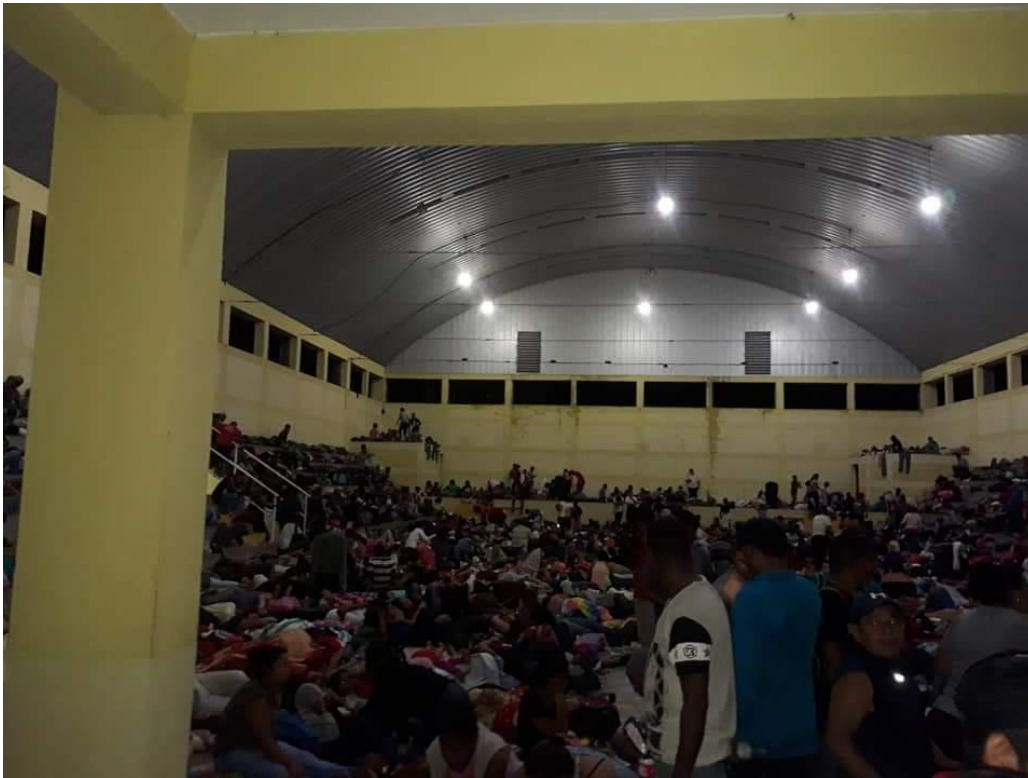
Foto 1. Personas de la caravana de hondureños pernoctando el CAP de la iglesia católica en Chiquimula (17/10/2017)