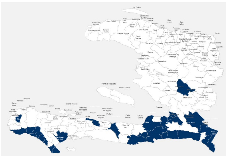
Communes les plus touchées par les inondations suite au passage de la tempête tropicale Laura à la date du 25 août, 9h00.