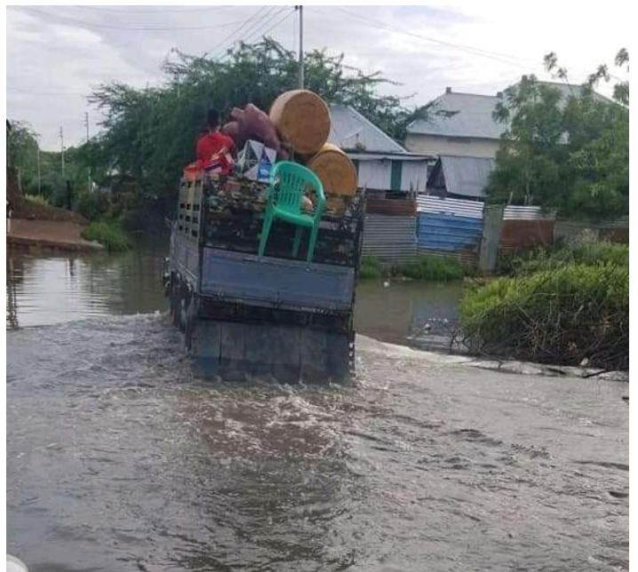
Qoosas ku barakacay daadadka Beledweyn.

Galmudug: Gudigadaadadka ee Galmudug ayaa ku qiyaasey in 12,000 oo qof ay ku barakaceen daadad ka dhacay Bacadweyne, degmada Hobyo, kadib roobab mahiigaan ah oo da'ay 2 Maajo. Laba wiil ayaa ku dhintay, 25 kalena waa ku dhawacmeen. Intaa waxaa dheer, 133 ari ayaa ku naf waayay roobabka, qiyaastii boqolkiiba 80 dukaamada ayaa ku waxyeeloobay. Koonfurta Gaalkacyo, daadad ayaa barakiciyay qiyaastii 6,840 barakacayaal ah. Dhuusamareeb, biriq ayaa dishay afar carruur ah, waxaana kuku barakacay 2,400 oo qof tuulada Waxaracade. Hay'adaha ayaa soo sheegaya in barakacayaashu ay u baahan yihiin hoy iyo agabyo kale.