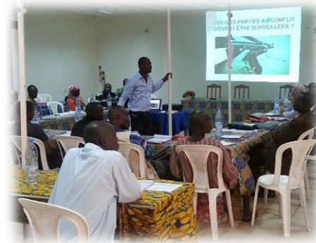
Le 30 avril 2014

Le Cluster (UNICEF et Enseignement catholique associé de la Centrafrique - ECAC) a organisé une formation de trois jours sur l'éducation en situations d'urgence du 28 au 30 avril. La formation avait pour but de renforcer les capacités des membres du Cluster en temps de crise. Une trentaine de participants membres du Cluster ont appris et discuté des domaines tels que l'importance et les composantes techniques de l'ESU, les normes minimales de l'INEE, la conception, le suivi et l'évaluation d'un programme d'ESU, l'éducation inclusive, l'appui psychosocial et le MRM attaques contre les écoles.