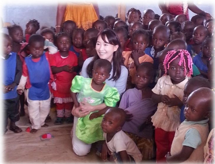
L'ambassadrice de bonne volonté du Comité national de l'UNICEF au Japon, Mme Agnes Chan lors de sa visite aux ETAPes à Boy Rabe dans le 4 e arrondissement de Bangui.

Le 18 avril 2014, crédit photo : Ye Ra KIM, UNICEF, 2014