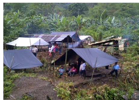
Albergues improvisados

HelpAge tiene la posibilidad de entregar 92 kits de ayuda humanitaria con enfoque diferencial para la población adulto mayor.