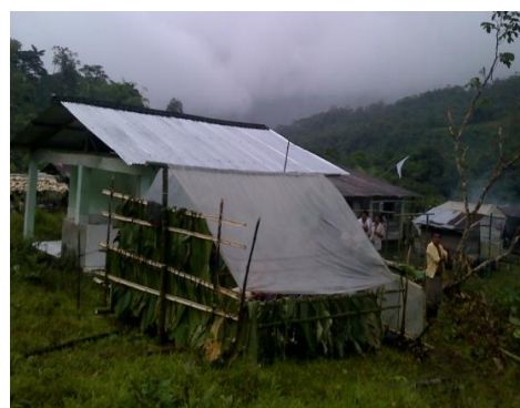
Escuela de Nulpe Medio