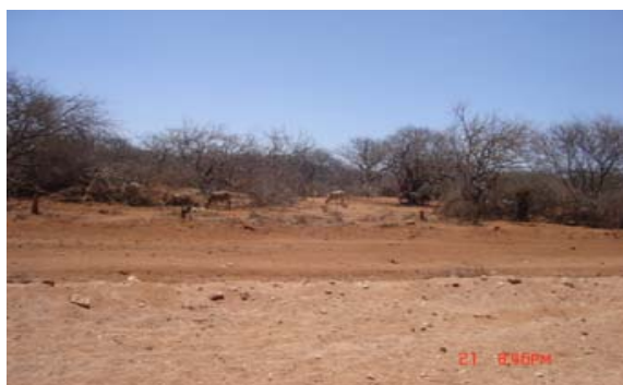
Certains endroits de la Région de Somali sont restés sans pluies, (Photo: OMS Ethiopie)