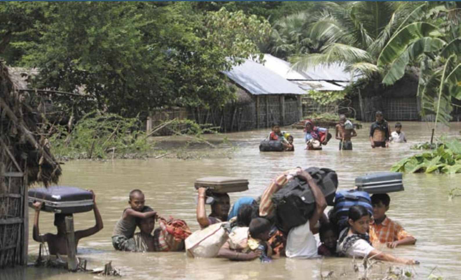
Floods in the State of Bihar: the situation is evolving and IDPs may very well move again / Inondations dans l'Etat du Bihar : la situation est en constante évolution et les populations déplacées sont encore susceptibles de se déplacer