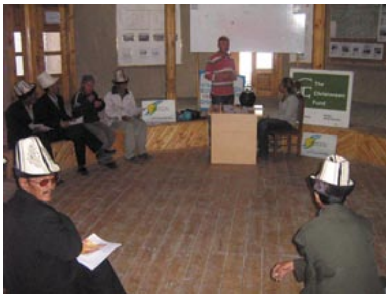
ACTED and SEEDS organised and conducted a three day seminar on the theme "Solar Energy and Environmental Preservation" / ACTED et SEEDS ont organisé un séminaire de trois jours sur le sujet de l'énergie solaire et de la protection de l'environnement

A series of educational seminars are being conducted in the framework of the project "using governance, cultural promotion and ecological protection as pathways to sustainable economic development" implemented by ACTED in Murghab Base. In Murghab, ACTED works in close cooperation with the International Non-Governmental Organisation "SEEDS". Together they organised and conducted a three day seminar on the theme "Solar Energy and Environmental Preservation" in June 2008, and "SEEDS" Country Director was in charge of the training.