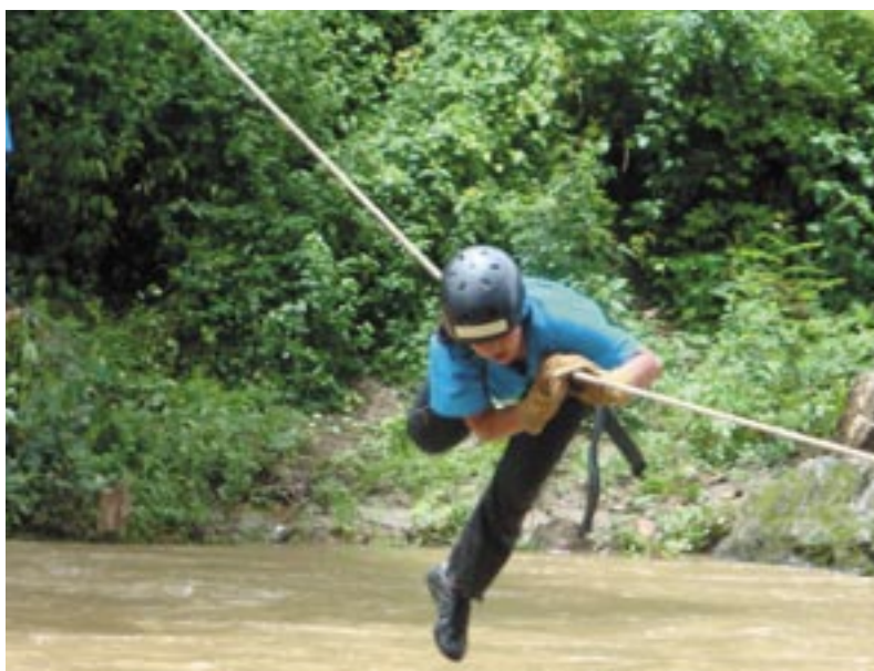
The organisation of real-size disaster response simulations is one of the components of this wide-reaching project / L'organisation d'une simulation de réponse à une catastrophe aux dimensions réelles est une composante essentielle de ce programme.

The goal pursued by ACTED is to empower the communities to hand on their knowledge. ACTED's expertise in the field of disaster preparedness should now be used to integrate all remaining vulnerable communities in the national system for disaster preparedness and relief.