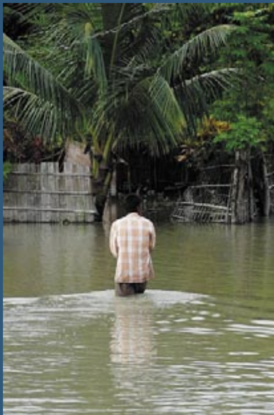
The floods caused record-high devastation in Bihar / Les inondations ont causé des dégâts de grande ampleur dans dans le Bihar

Grâce à ces interventions, ACTED a acquis une connaissance approfondie des difficultés auxquelles les communautés touchées par les inondations doivent faire face.