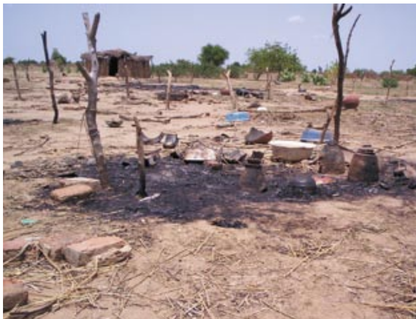
Scarce access to water leads to tensions between the communities living in the region / L'accès à l'eau est à l'origine de tensions entre et au sein des communautés présentes dans la région

ACTED, with the support of OFDA, will implement a sustainable approach in this field in order to improve the life and health conditions of more than 10.000 Chadian people, both IDPs and host populations. Its intervention will include water, sanitation and hygiene promotion activities and the construction of wells, water points, washhouse and the support to village communities for regular rubbish collections. The construction of drilling and wells will not be enough to improve life conditions of hosting and displaced populations in the long term therefore hygiene and sanitation promotion activities are to be implemented to assure the sustainability of the programme.