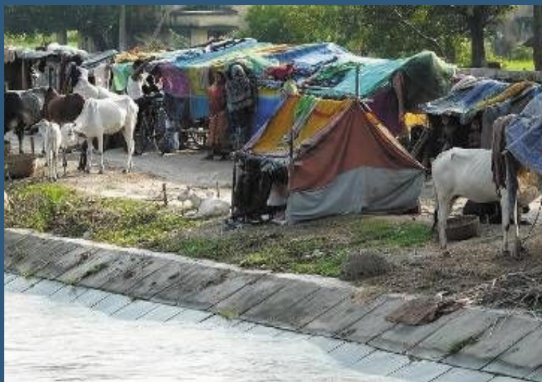
ACTED's intervention helps the most vulnerable household to cope with food insecurity / L'intervention d'ACTED permet de fournir une aide alimentaire d'urgence pour les ménages les plus vulnérables.

La construction d'abris est une autre composante de l'intervention d'ACTED. D'une manière générale, les camps n'offrent que des abris et des installations de fortune à leurs occupants qui vivent dans des conditions extrêmement précaires alors que les pluies de la mousson continuent à tomber. Des bâches sont donc distribuées afin d'étanchéifier les abris de fortune construits à la hâte