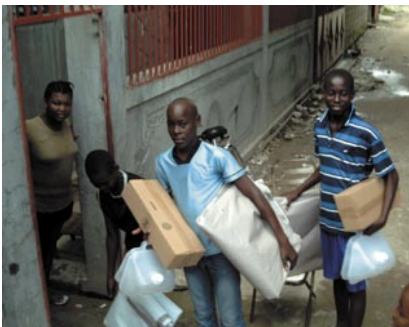
The most vulnerable households received two hygiene kits in order to better meet their needs / Les ménages les plus vulnérables ont reçu deux kits d'hygiène pour mieux faire face à leurs besoins

The death toll is further increased by the poverty of this country and because of its fragile infrastructure which are still hit by heavy rains which continue to fall. The small mud houses, which are very common in the rural areas, are easily knocked down by mud flows which flood the villages. The situation of the agricultural sector is critical too. It has been assessed that more than 20,000 hectares of crop have been destroyed. Haiti, already affected by the food crisis which provoked riots in April, has to cope with a likely food security crisis because of the heavy loss of cattle killed by the floods and the destruction of crops.