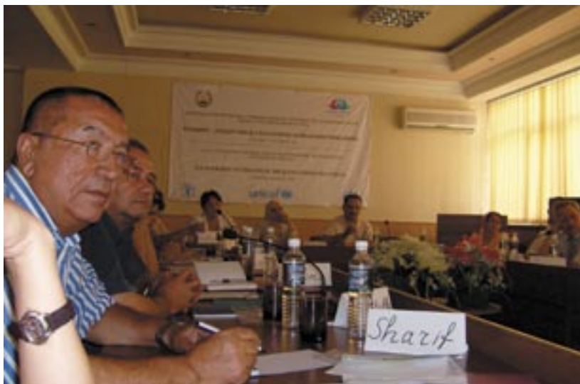
ACTED's health education staff attended a workshop organized by UNICEF on "Leadership and communication strategy" / Le staff d'ACTED chargé de l'éducation à la santé a participé à un atelier de organisé par l'UNICEF sur le thème « Leadership et Stratégie de Communication »