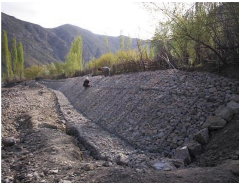
Kyrgyzstan, a mountainous landlocked country, is prone to significant natural disasters / Le Kirghizistan est un pays complètement enclavé par les montagnes et donc particulièrement à risque face aux catastrophes naturelles

The cross border village Bojoy of Batken region was selected for implementing one of the river bank protection projects. Settled close to mountains, residents of Bojoy frequently experience agricultural losses and infrastructure damages caused by mudflow occurrences as the protection structures in their village have been deteriorated since the collapse of the Soviet Union. The main purpose of this mitigation work was the creation and capacity development of a Project Steering Committee (PSC) in Bojoy for the implementation and maintenance of the river bank protection project. The PSC was involved in all the stages of project implementation being responsible for gathering and organizing community contributions.