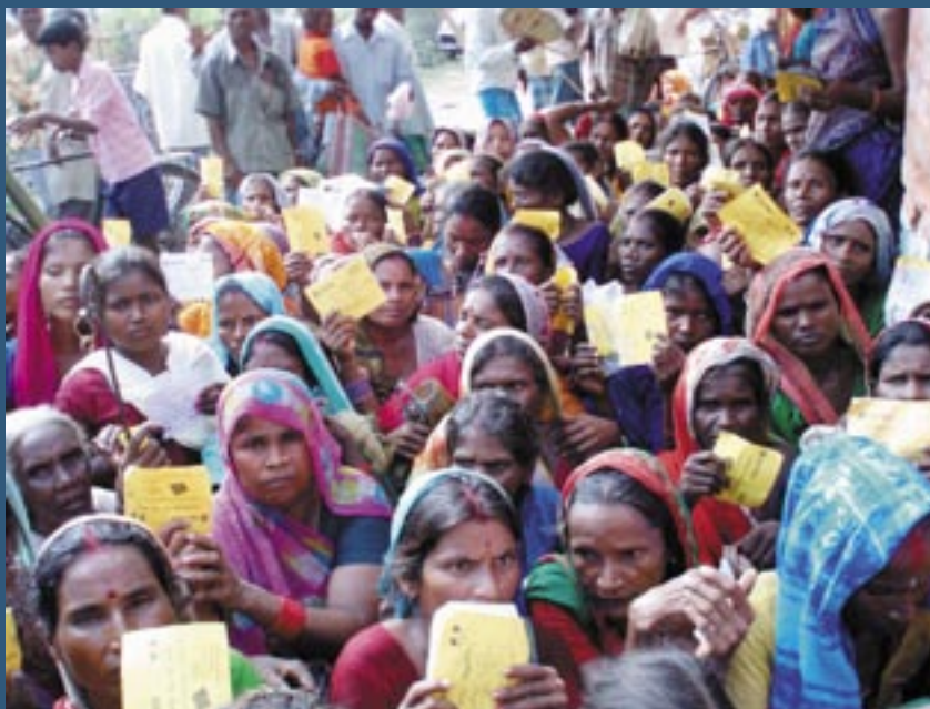
ACTED is helping the most vulnerable households to cope with food insecurity / L'intervention d'ACTED vise à fournir une aide alimentaire d'urgence pour les ménages les plus vulnérables

play an important role: it will be very important to support the promotion of community-based disaster risk reduction. This will help local populations to be prepared to face similar emergency situations in the future.