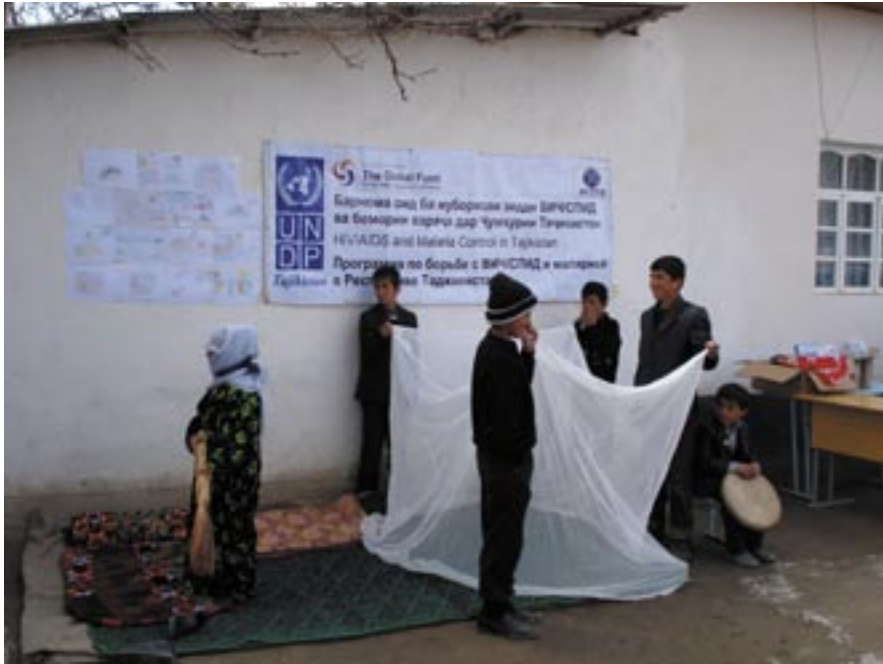
Theatre performances as well as competitions will be organised on health-related topics / Des pièces de théâtre ainsi que des compétitions abordant la problématique de la santé seront organisées

Etant donné que les enfants sont considérés comme les destinataires principaux de la formation sanitaire, les