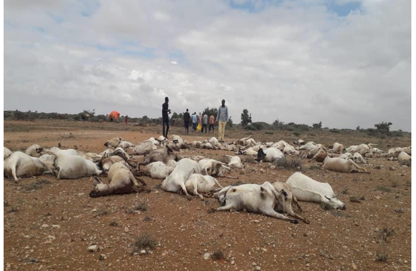
Duufaanta ayaa dishay xoolo badan ee deeganada Puntland, OCHA

Kooxda nafaqada ayaa waxay si dhaw ula socotaa dadka eey waxyeelada kasoo gaartay duufaanta si loo hubiyo adeegyada nafaqada islamarkaana looga fogaado in eey dhacdo nusqaan gaar ahaan kiisas nafaqo darada iyo barakaca bulshada.