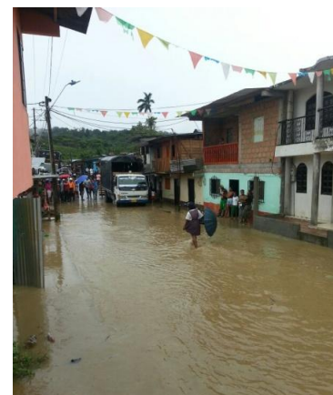
Foto 1: Inundaciones en Nóvita.