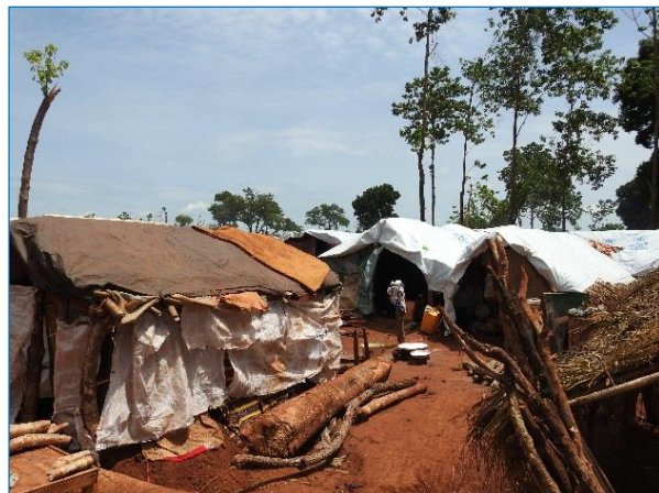
Bria. Préfecture de la Haute Kotto. Une vue du site de PK3.

Une réponse d'urgence a pu être apportée en termes de médicaments et d'autres intrants (remis par l'OMS et l'UNICEF) pour améliorer l'accès à l'eau, l'hygiène et l'assainissement à Nguédéré en faveur du centre de santé de Mingala, 7 Km au Nord-est. D'après les observations de la mission, les besoins les plus urgents sont la protection et la santé.