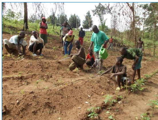
Berberati. Préfecture de la Mambéré Kadéï, RCA (3 septembre 2018). Au centre « Sara mbi gaz o », des enfants apprennent non seulement les activités agro-pastorales, mais ils font aussi de la musique.

Dans ce centre, il y a également des activités piscicoles. Les revenus générés par ces activités agropastorales et piscicoles contribuent à pérenniser les activités du centre. En plus, le centre organise des cours d'alphabétisation et des activités sportives et musicales.