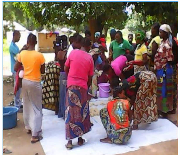
Batangafo. Préfecture de l'Ouham, Distribution de produits d'hygiène aux déplacés.

Le projet du Fonds humanitaire, axé sur la réhabilitation de ces ouvrages, a ainsi permis de maintenir propre et accessible dans le respect de la dignité des usagers, les douches et les latrines.