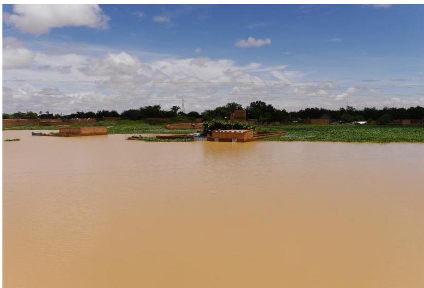
Niamey, Commune V, une vue d'habitations du quartier kirkissoye sous les eaux suite aux pluies diluviennes

Par milliers, les habitants de ces quartiers ont abandonné leurs domiciles pour trouver refuge dans des endroits plus sûres chez des parents, des voisins ou dans des écoles. Outre les domiciles, les habitants ont constaté avec désolation l'inondation du Centre Hospitalier Universitaire (CHU), de la Faculté de Science et de la Santé (FSS) de l'Université Abdou Moumouni de Niamey, une scène surréaliste, du jamais vu de mémoire de Niameen, d'après des témoins.