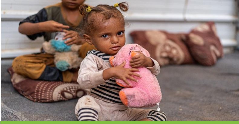
الفترة المشمولة بالتقرير: 1- 31 أغسطس 2021