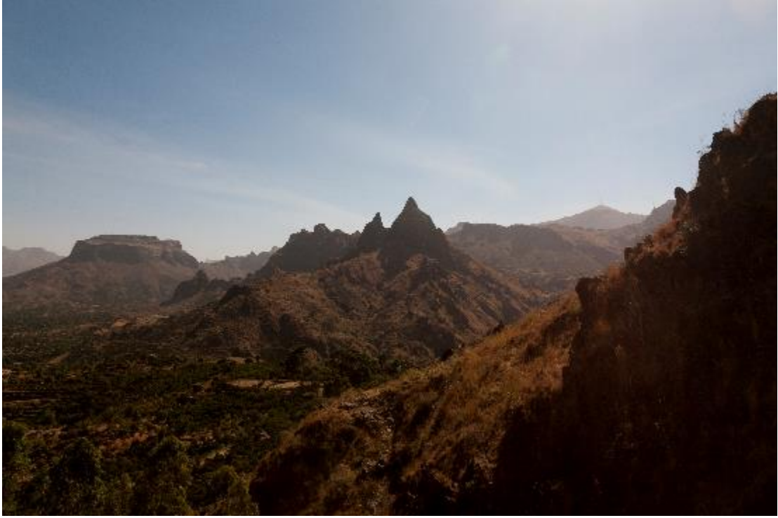
جبال منطقة جبل مرة خارج دورسا بوسط دارفور، السودان، مارس/آذار 2015