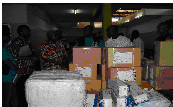
Contribution de l'OMS au Ministère de la Santé après l'explosion de la citerne de carburant, Gbahon/RCA