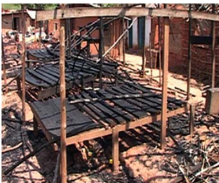
Horreur à Dongo, Province Equateur/RDC: le marché et des habitations brûlés