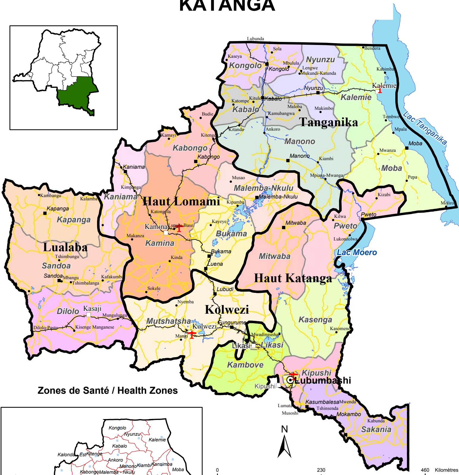
Zones de Santé / Health Zones