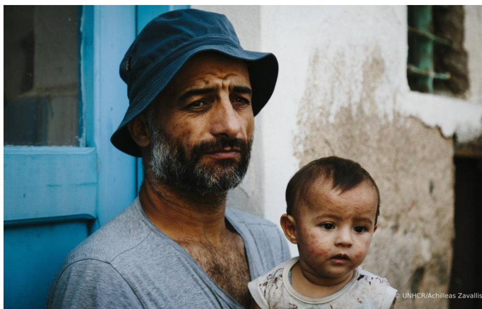
Ένας αιτών άσυλο από τη Συρία κρατά στην αγκαλιά του τη μικρή κόρη του, έξω από ένα εγκαταλελειμμένο κτίριο κοντά στο κέντρο υποδοχής στα Λέπδα, στη Λέρο.

10 Γραφεία σε Θεσσαλονίκη, Λέσβο, Αττική, Χίο, Σάμο, Κω, Έβρο, Ιωάννινα, Λέρο και Ρόδο