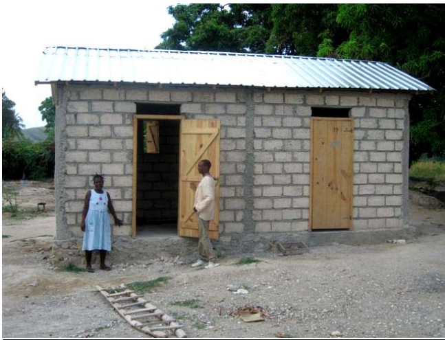
Une maison terminée dans le village de Passe Reine dans Gonaïves rural avec la technique 'safer building' pour résister à la pression des vents.